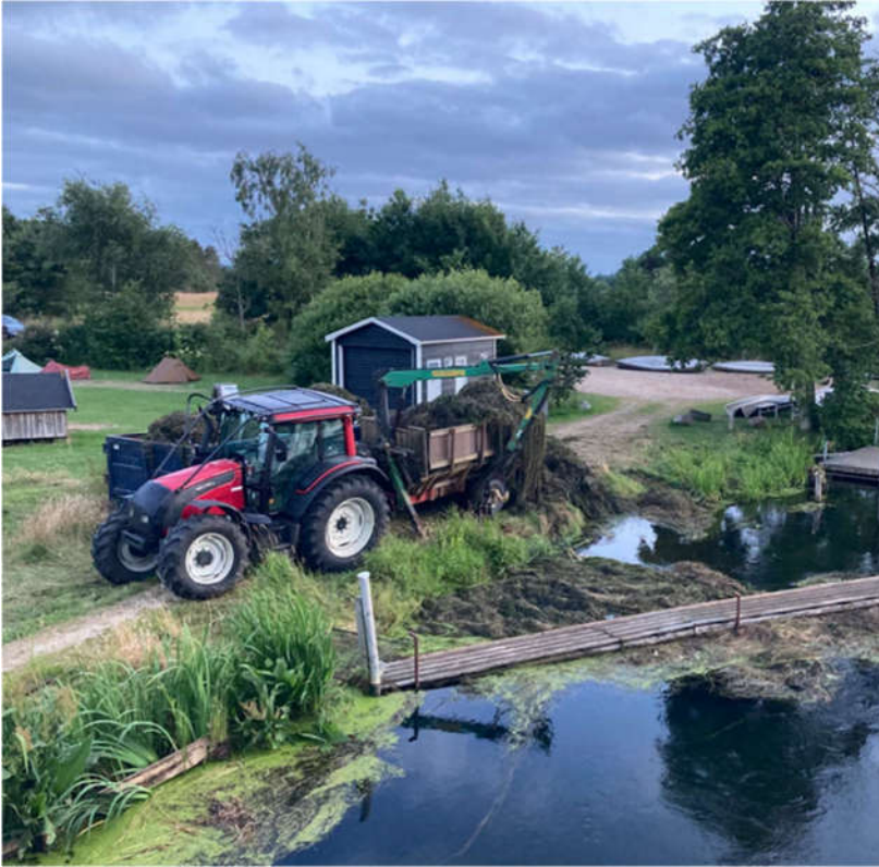
Indtryk fra grødeskæring